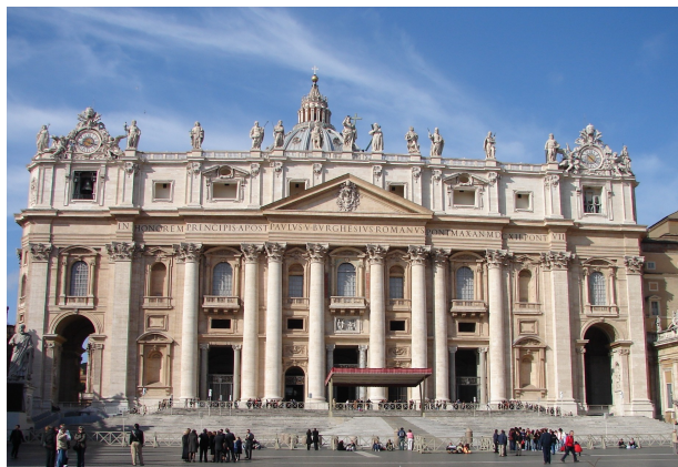
Watykan - Bazylika św. Piotra

Bardzo ważnym wydaje się również polityczny kontekst chrystianizacji, dzięki której Polska włączona została w chrześcijański krąg cywilizacyjny. Umożliwiła ona również unifikację religijną tworzącego się społeczeństwa, a dla władcy stosunek do nowej religii był swoistym testem lojalności poddanych wobec państwa.