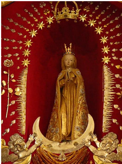
Cudowna Figura Matki Bożej Skępskiej